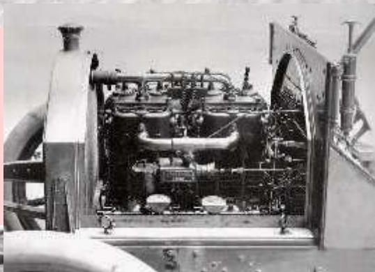
Der Motor: paarweise Zylinder

Die Angabe der Steuer-PS prägte die Typenbezeichnungen bis Ende der 20er Jahre. Für Viertaktmotoren entsprach ein Steuer-PS einem Hubraum von 261,8 cm 3 .