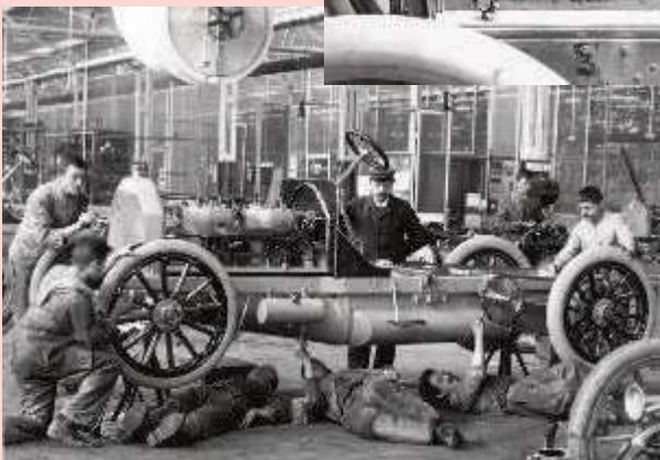
Fertigung / Endmontage Fließband Fehlzanzeige!