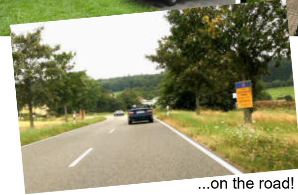
...on the road!