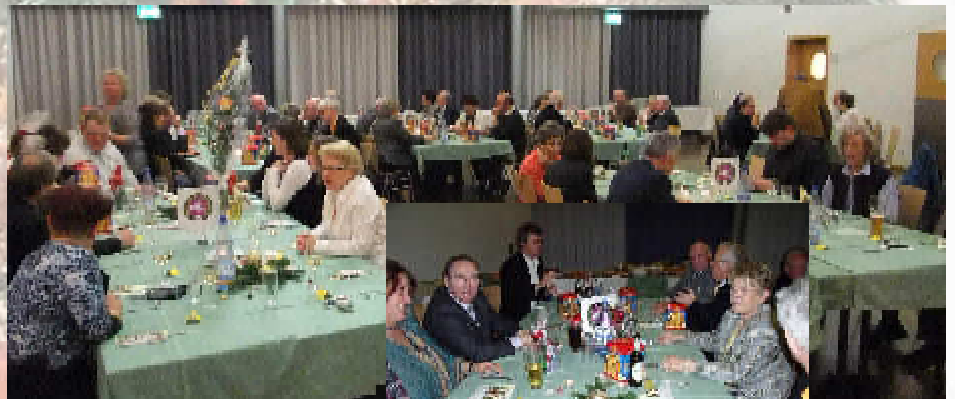
Die Mitglieder fühlten sich sichtlich wohl