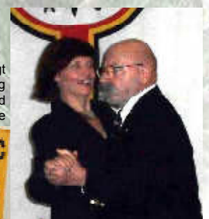
Beschwingt ging der Abend zu Ende