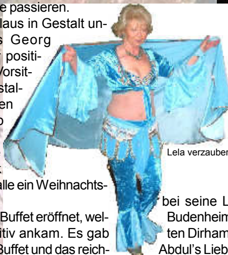
Lela verzauberte uns