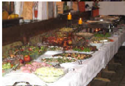
Gemütlichkeit und gutes Essen halten Leib und Seele zusammen!