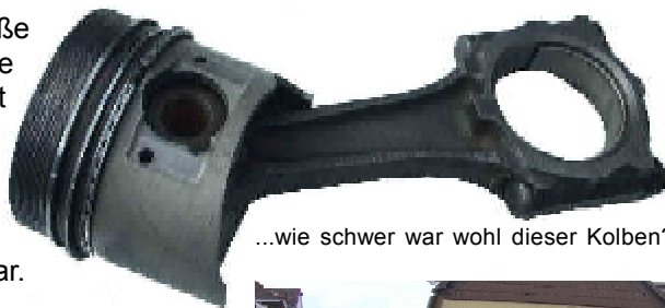
...wie schwer war wohl dieser Kolben?

Für viele war die große Überraschung die Streckenführung. Nicht wie üblich durch Rheinhessen sondern durch den schönen Taunus ging die Ausfahrt, die mit 6 DK's gespickt war.