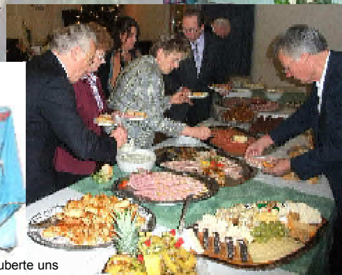
Das opulente Buffet verwöhnte uns