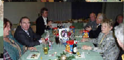
Die Pokale warten schon